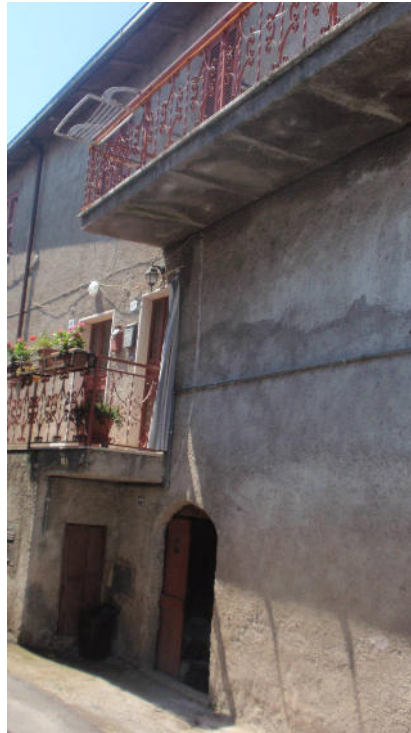
FOTO 1-2 Ingresso principale e terrazzi