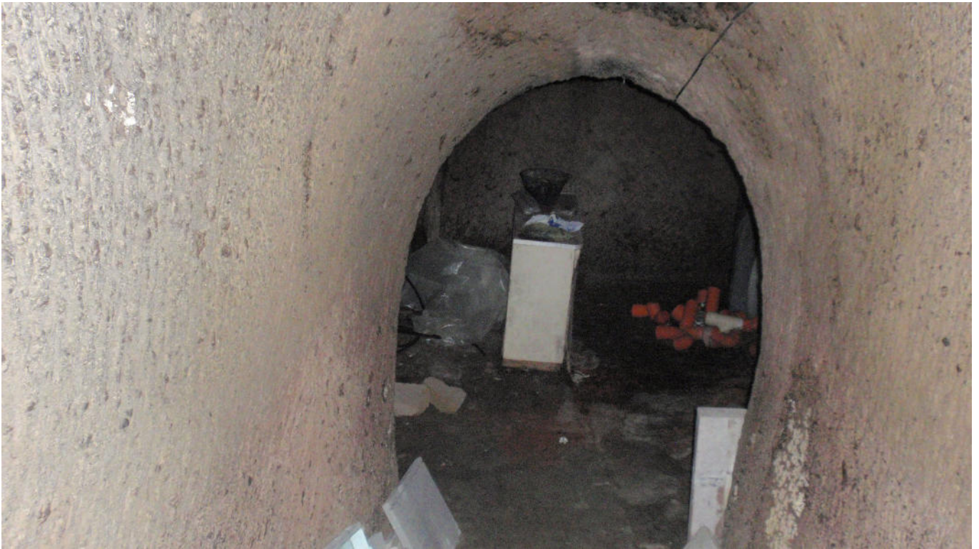
FOTO 9-10 Cantina