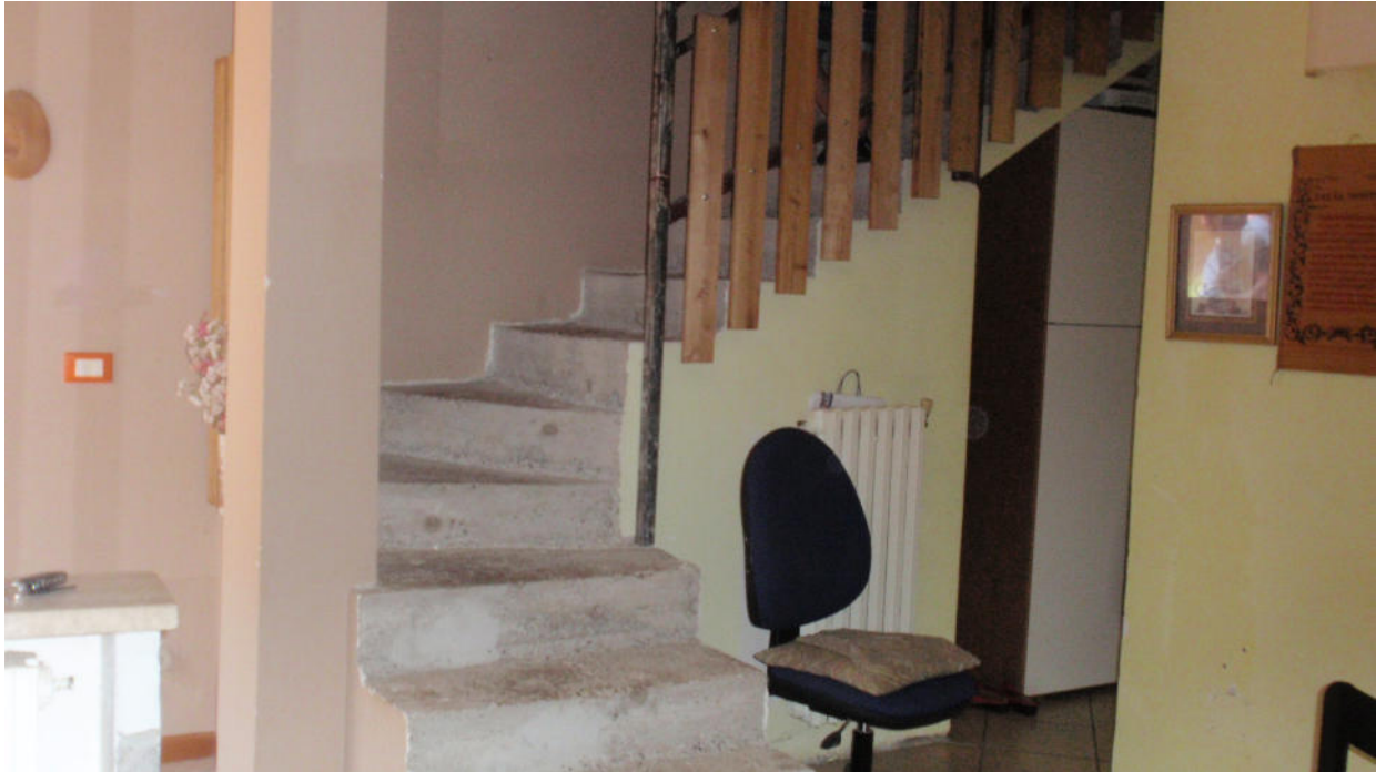
FOTO 3-4 Zona giorno piano primo