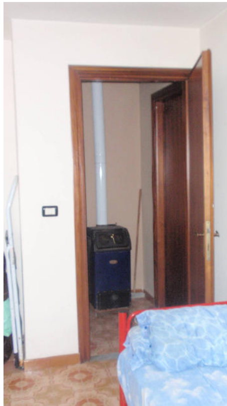
FOTO 5-6 zona notte piano secondo